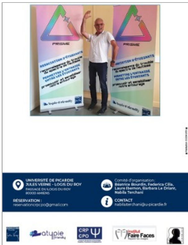
Journée scientifique - en l'honneur de Luc Vandromme "Le trouble du spectre de l'autisme, études en psychologie du développement" 27 mai 2024 - Logis du Roy - Amiens