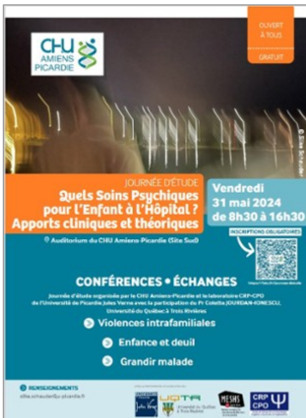
Journée d'étude - Quels soins psychiques pour l'enfant à l'hôpital ? Apports cliniques et théoriques - 31 mai 2024